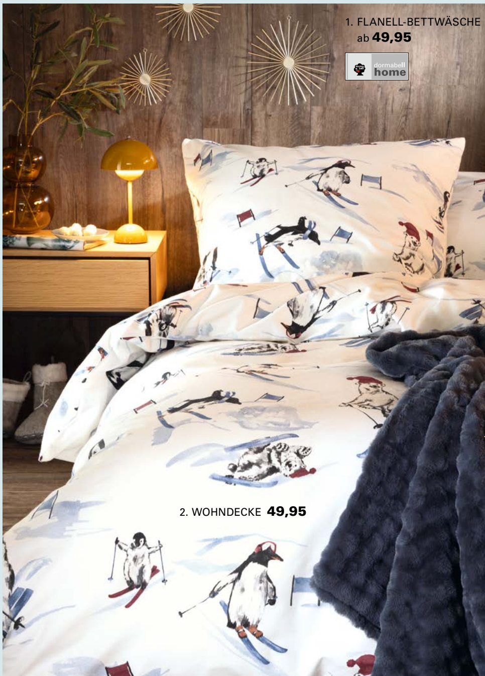
1. FLANELL-BETTWÄSCHE ab 49,95