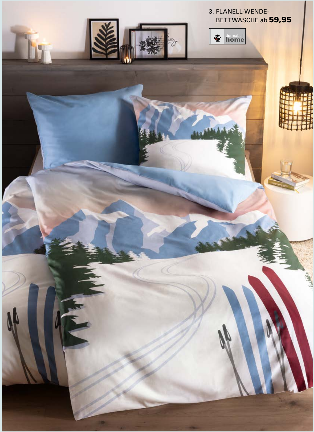
3. FLANELL-WENDE- BETTWÄSCHE ab 59,95

1. FLANELL-BETTWÄSCHE: Diese Bettwäsche verwöhnt im Schlaf – mit ausdrucksstarkem Dessin, einem harmonischen Farbspiel in sanften Blau- und Rosétönen und weicher, wärmender Flanell-Qualität. Aus 100 % Baumwolle. Mit Reißverschluss. 135 / 200 cm 69,95, 155 / 220 cm 89,95. 2. NACKENSTÜTZKISSEN DORMABELL CERVICAL: Softiges, zweiteiliges Latexkissen zur perfekten Druckverteilung. Mit atmungsaktivem Bezugstoff, durch Reißverschluss abnehmbar und bei 60 °C waschbar. Preisbeispiel: NB 4 139,95. 3. FLANELL-WENDE-BETTWÄSCHE: Ein winterliches Sehnsuchtsmotiv im Retro-Stil auf der Vorderseite, die Rückseite in Uni-Blau. Wunderbar kuschelig durch weichen, anschmiegsamen Flanell. Aus 100 % Baumwolle. Mit Reißverschluss. 135 / 200 cm 59,95, 155 / 220 cm 69,95.