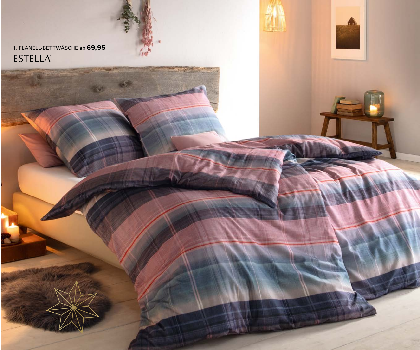
1. FLANELL-BETTWÄSCHE ab 69,95 ESTELLA